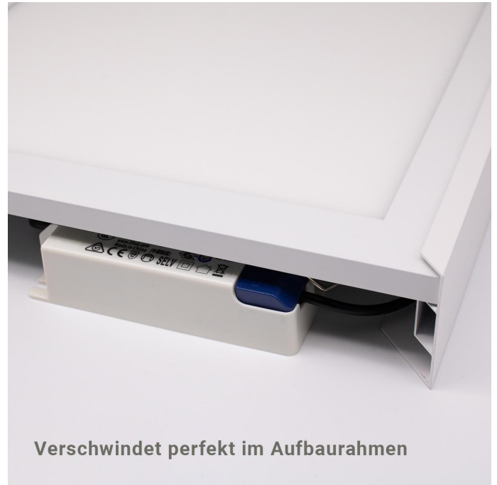
Verschwindet perfekt im Aufbaurahmen