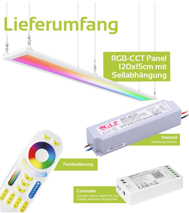
RGB-CCT Panel 120x15cm mit Seilabhangung