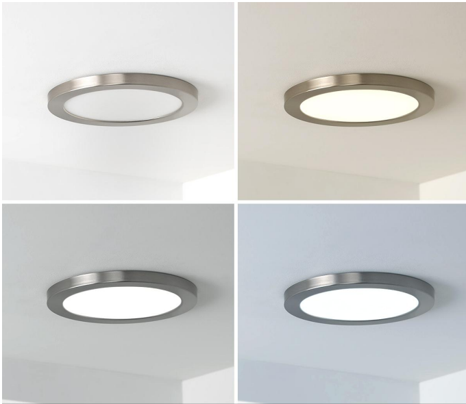
CCT-Farbauswahl warm-, neutral- oder kaltweiß per DIP-Schalter einstellbar