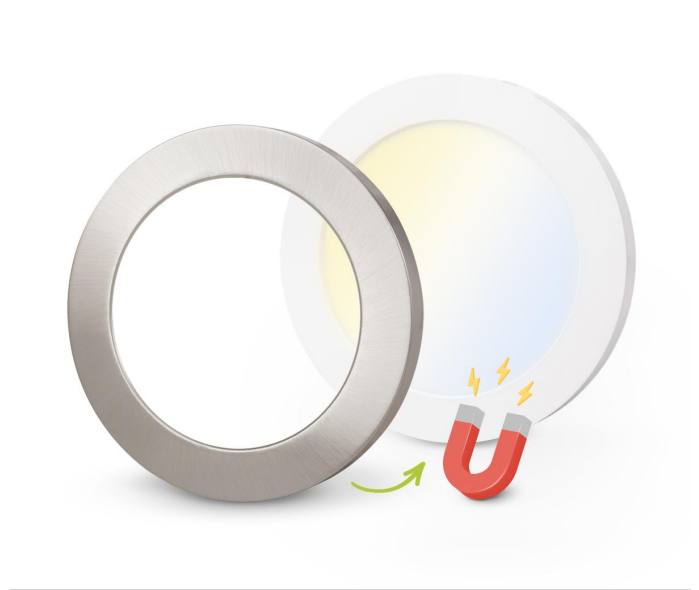
Magnetische Abdeckung schnelle, einfache und werkzeuglose Montage