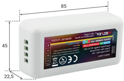
Angaben in mm