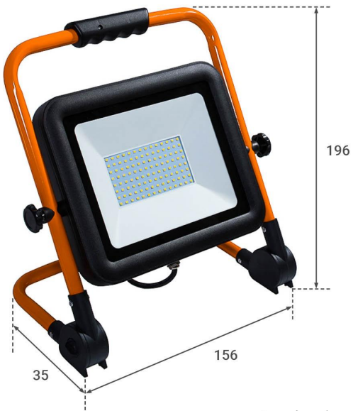
Angaben in mm