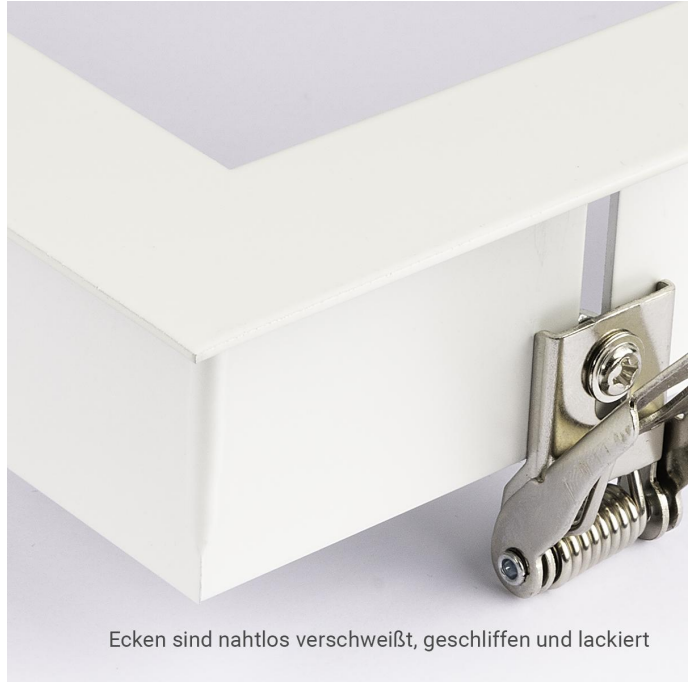
Ecken sind nahtlos verschweißt, geschliffen und lackiert