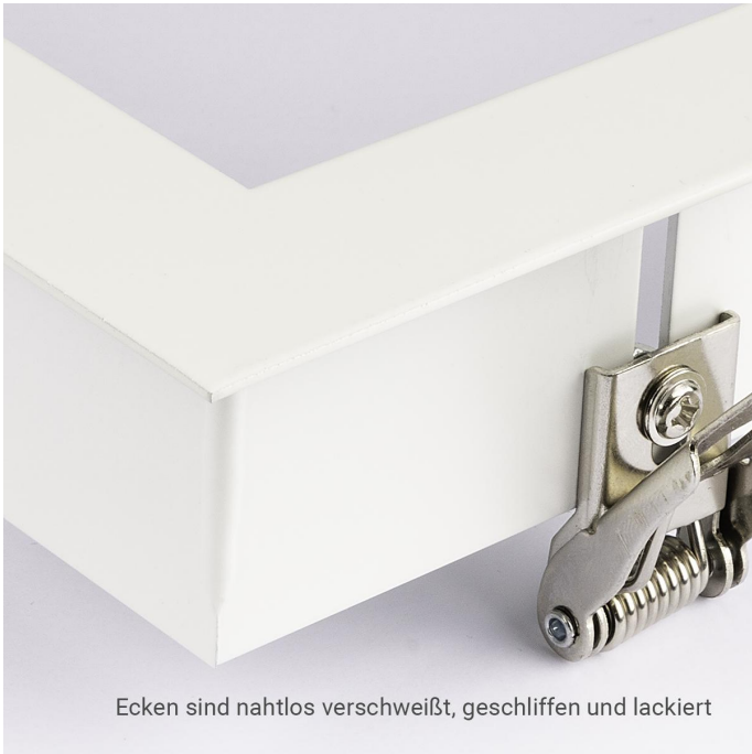
Ecken sind nahtlos verschweißt, geschliffen und lackiert