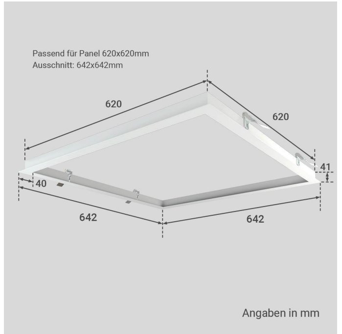
Angaben in mm