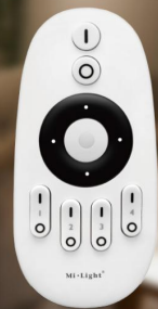
Artikel-Nr. 3467 FUT007