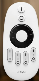
Artikel-Nr. 1448 FUT006